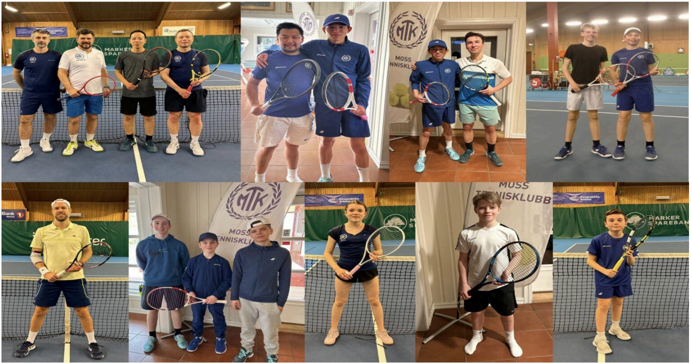
(Bilde fra UTR turnering)