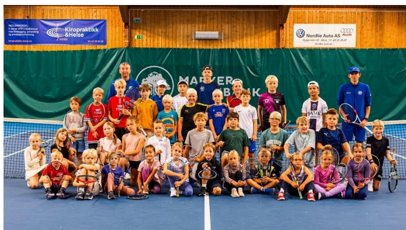
(Bilde fra en av sommertennisskole ukene)

Sommertennisskole: I uke 26, 27 og 32 deltok 59 ivrige spillere på klubbens sommertennisskole. Hver dag var fylt med spennende treningsøkter, lek, teknikk, kamper og nye vennskap. Både nybegynnere og viderekomne utviklet ferdighetene sine under veiledning av engasjerte trenere. Sommertennisskolen er en tradisjonsrik del av Moss Tennisklubb og et populært tilbud blant medlemmene.