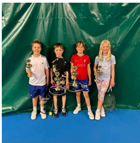
(Bilde fra en Panda Tour turnering)

I tillegg startet klubben i 2025 sin egen Panda Tour, en klubbturnering for spillere med rød og oransje ball. Åtte Panda Tour turneringer ble gjennomført i løpet av året. Målet med Panda Tour er å gi spillerne et første steg inn i konkurransespill, slik at de på en enkel måte kan introduseres for kamper på hjemmebane.