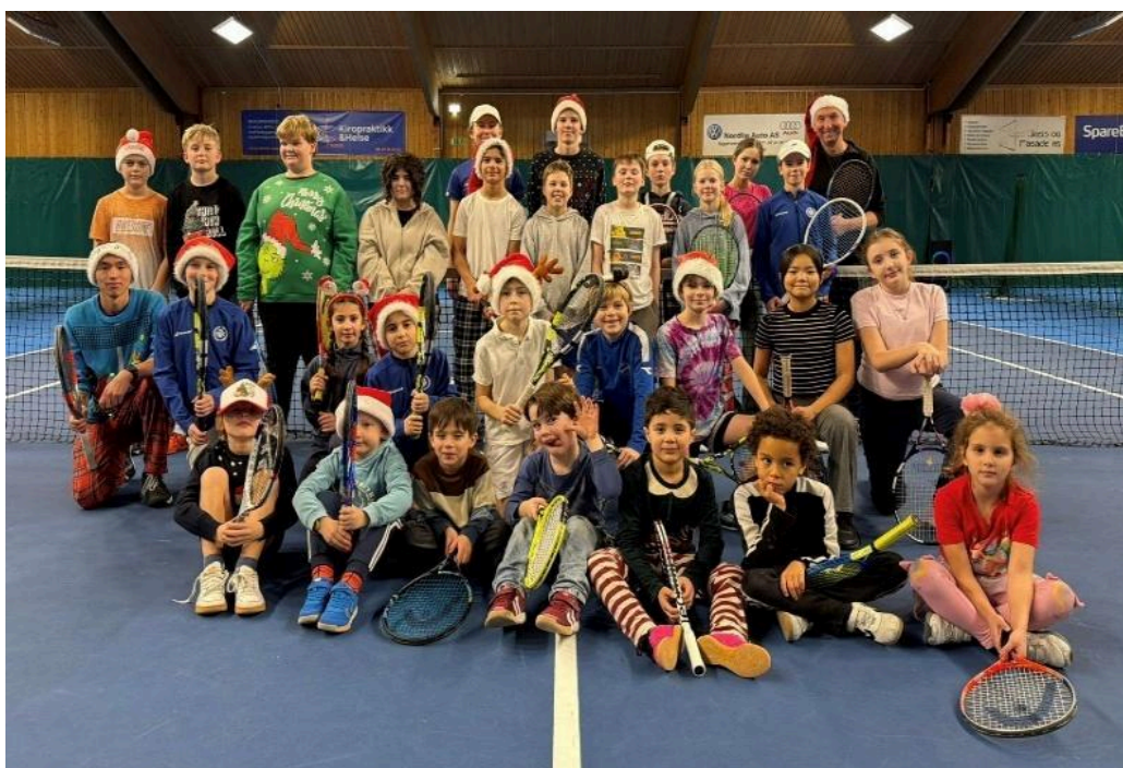
(Bilde fra juleavslutning)