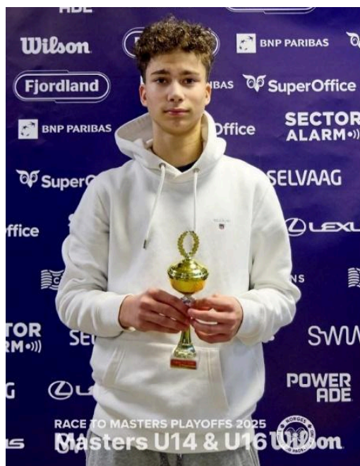
(Bilde fra Masters U14 )

Hans innsats og resultater er et forbilde for øvrige spillere i rekrutt og konkurransegruppen, samt for andre medlemmer i klubben.