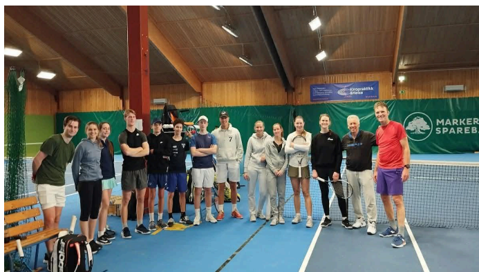
(Jul/nyttårs bilde med konkurranse/gjestespillere/sparringspartnere)

Dette har vært utrolig givende turer for våre spillere, hvor det kombineres med kamper, trening og sosialt samvær, som styrker samholdet blant spillerne!