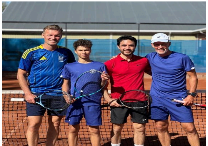
(Bilder fra laget, Pål Henriksen mangles på bildene)