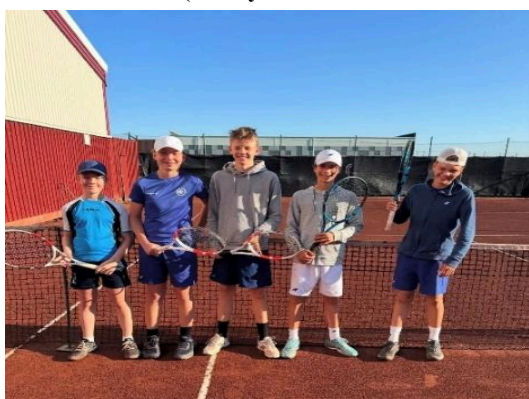
(Bilde fra klubbturen Räkantennisen Strömstad)