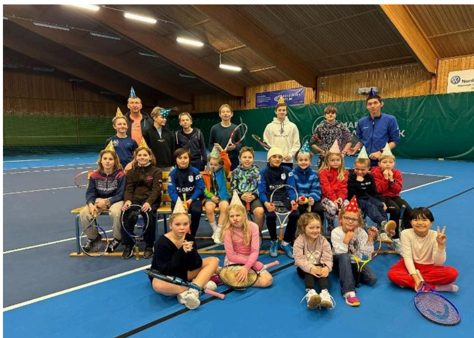
(Bilde fra Bursdagsfeiring)4

I tillegg har klubben arrangert Ares kakekveld og Halloween-tennis , som begge har vært populære aktiviteter blant juniorene.