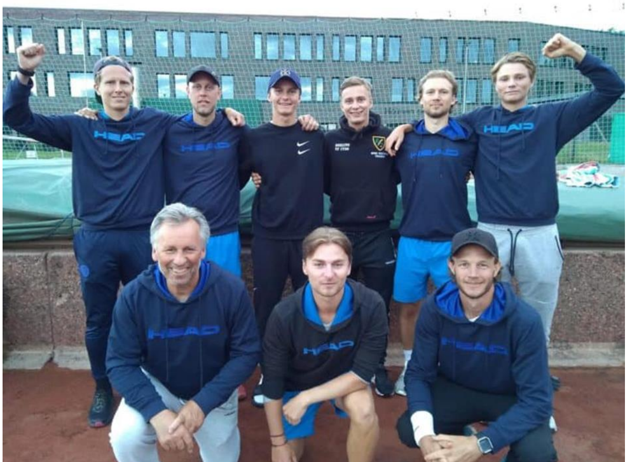
Moss TK herrene tok sølv i Eliteserien 2020